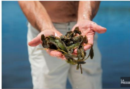
Le myriophylle à épi, qui se reproduit par bouture plutôt que par germination, se propage rapidement dès qu'on la sectionne avec une hélice de bateau ou avec une pagaie. Sa population croît rapidement si on ne l'élimine pas avec d'autres plantes aquatiques et les poissons qui y fraient.