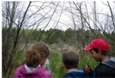
Visite d'un milieu humide.