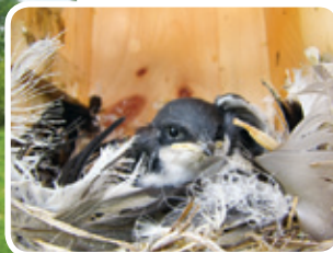
Jeunes hirondelles bicolores Projet ruisseau Richer

« L'implantation de nichoirs à hirondelle bicolor met de la vie dans nos champs. Chaque printemps, nous attendons leur arrivée. »