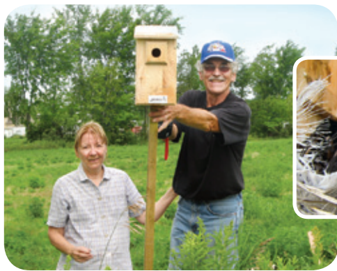
Nichoir à hirondelles Projet ruisseau Richer

Description • Les nichoirs peuvent être utilisés par des passereaux (hirondelle bicolor, merlebleu de l'Est, troglodyte familier), des rapaces (crécerelle d'Amérique, petit-duc maculé, chouette rayée)