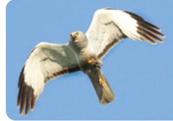
Busard Saint-Martin

pour construire son nid de boue. Le goglu des prés et la sturnelle des prés établiront plutôt leurs nids dans les prairies et les pâturages. Quant au busard Saint-Martin et à la crécerelle d'Amérique, deux rapaces typiques du milieu agricole, on les aperçoit souvent planant au-dessus des champs, à l'affût de leur proie (rongeurs, oiseaux et insectes). D'autres oiseaux utilisent occasionnellement le milieu agricole lors de leurs migrations, tels que le grand harle, qui utilise les plans d'eau, et l'oie blanche, qui se nourrit des grains de maïs. D'ailleurs, quelques espèces s'avèrent parfois nuisibles aux récoltes lorsqu'elles sont présentes en grande densité, comme l'oie blanche ou certains « oiseaux noirs » (étourneaux sansonnets).