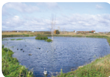
Étang aménagé Projet rivière Boyer Sud

Il est important de surveiller l'apparition dans l'étang d'espèces végétales envahissantes comme la salicaire pourpre et de les contrôler le cas échéant.