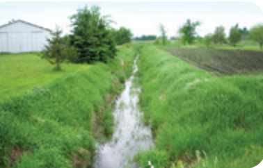
Projet ruisseau des Aulnages

En évitant le fauchage des fossés, on offre aux oiseaux un couvert de protection, des sites de reproduction et des sources d'alimentation.