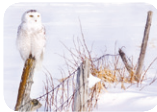
Perchoir - Jocelyn Claveau/QCN

La plantation de piquets de cèdre le long d'un fossé tous les 200 m ou le maintien en place d'anciennes clôtures de pâturage permettront d'offrir des sites de guet, de repos ou de parade à de nombreuses espèces.