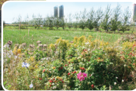
Plantation de produits forestiers non ligneux en bande riveraine Fédération de l'UPA de la Côte-du-Sud

Description • Une bande riveraine d'arbustes peut être réalisée en replat ou en talus sur une ou plusieurs rangées. Le choix des espèces dépend avant tout de la disponibilité des plants. Tout en privilégiant les plantes indigènes qui sont adaptées à la région, on doit considérer, dans le choix des espèces, d'autres aspects comme le type de sol, les conditions du milieu et l'objectif recherché. Par exemple, certaines espèces qualifiées de « produits forestiers non ligneux » (amélanchier, sureau) peuvent présenter un intérêt pour la transformation alimentaire de leurs petits fruits. Le producteur intéressé pourra recourir aux services d'un spécialiste pour planifier la plantation et choisir les espèces d'arbustes appropriées.