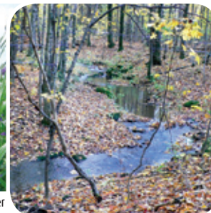
Projet rivière Boyer Sud