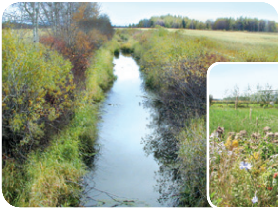
Bande riveraine arbustive offrant un corridor de déplacement vers un boisé Projet rivière Fouquette

But visé • Tout en stabilisant les berges et en réduisant l'érosion, la plantation d'arbustes aux abords des cours d'eau créera un habitat de choix pour certains oiseaux et elle pourra, en prime, leur assurer une quantité appréciable de fruits et de graines. Une bande riveraine arbustive constituera également un microhabitat où de nombreux insectes pollinisateurs s'installeront. Ces insectes serviront de source d'alimentation pour les oiseaux insectivores, qui, par ce fait même, s'alimenteront d'insectes indésirables aux cultures.