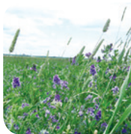
Projet ruisseau Richer

La remise en eau de tronçons de cours d'eau asséchés permettra de créer des sites d'alimentation ou de repos pour plusieurs espèces d'oiseaux aquatiques (canards et hérons).