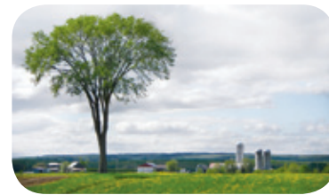
Projet rivière Niagarette

Les arbres isolés servent de perchoirs et de sites de guet, notamment pour les rapaces comme la crécerelle d'Amérique. Ils peuvent également servir de haltes entre deux sites forestiers.