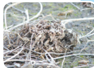
Champ en semis direct Projet rivière Marguerite