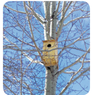
Nichoir à rapaces Projet ruisseau Morin

Entretien des aménagements • Les nichoirs doivent être vidés entre deux périodes de reproduction, sinon l'accumulation de matériaux, de parasites et de fientes à l'intérieur mènera à son abandon. Le tout doit se faire entre la fin septembre et le début de mars. Pour certains types de nichoirs, on en profitera pour y ajouter du nouveau matériel (paille, copeaux de bois).