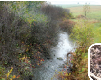
Projet rivière Fouquette

Le rajeunissement régulier d'une aulnaie (bosquet d'arbustes d'aulnes) par la coupe des secteurs plus âgés permet de maintenir un habitat propice à la bécasse pour élever les jeunes et se nourrir de vers de terres et d'insectes. Des sites également appréciés des chasseurs de bécasse.