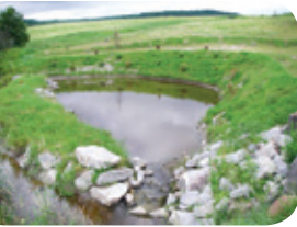
Projet rivière Niagarette

Les bassins de rétention servent à intercepter et à retenir les sédiments érodés. En plus d'améliorer la qualité de l'eau, l'aménagement d'un bassin de rétention sera profitable aux oiseaux, qui se nourriront des insectes qui gravitent autour.