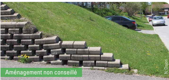
Aménagement non conseillé