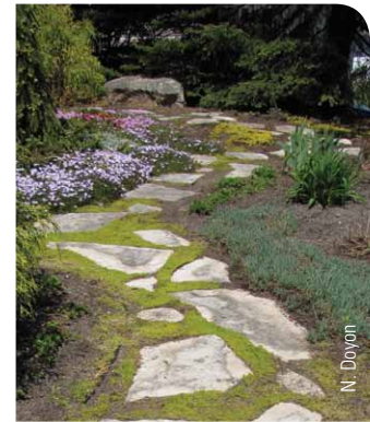
Bon aménagement : entrée limitée et surface perméable