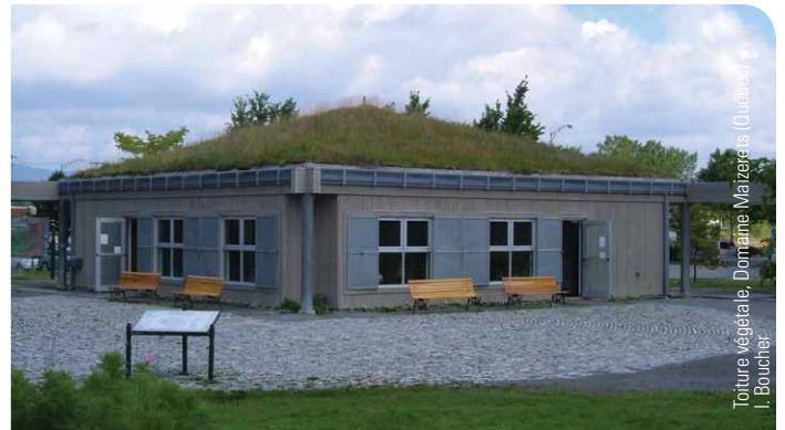
Toiture végétale, Domaine Maizerets (Québec) F. Bouchier

N'oubliez pas que l'imperméabilisation réduit le pouvoir filtrant des végétaux et des sols. Il est donc important de minimiser les surfaces imperméables de votre cour pour permettre à l'eau de s'infiltrer et de se purifier au maximum avant d'atteindre les cours d'eau.